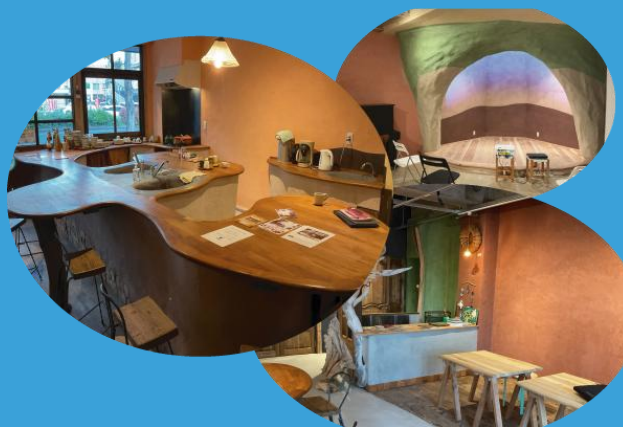
会場は、コスタリカ風内装の多目的施設 ラボラトリオツルーガ